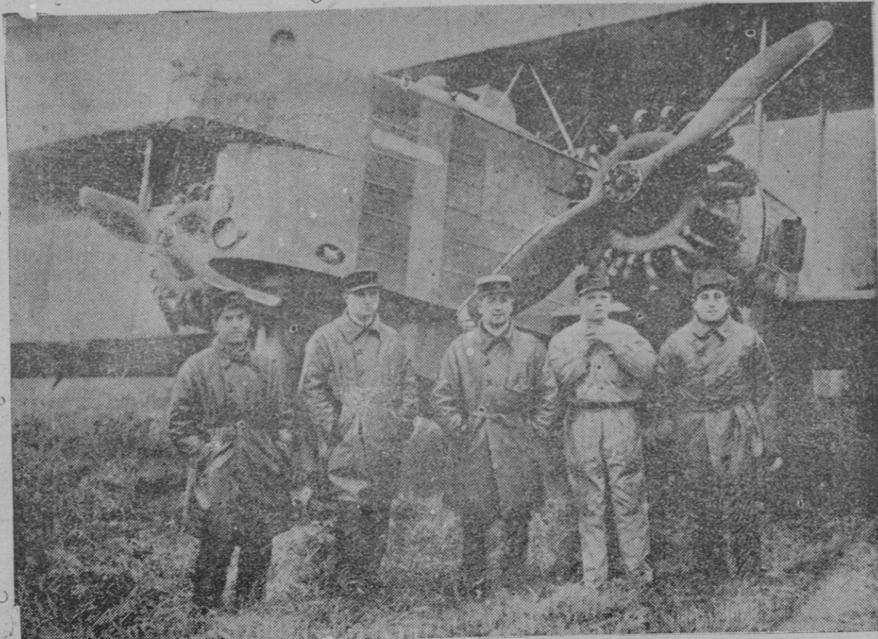
El avión «Georges Guynemer», en el Aerodromo de Le Bourget (Paris), que ha salido para el vuelo Paris-Hanoi, con su tripulación