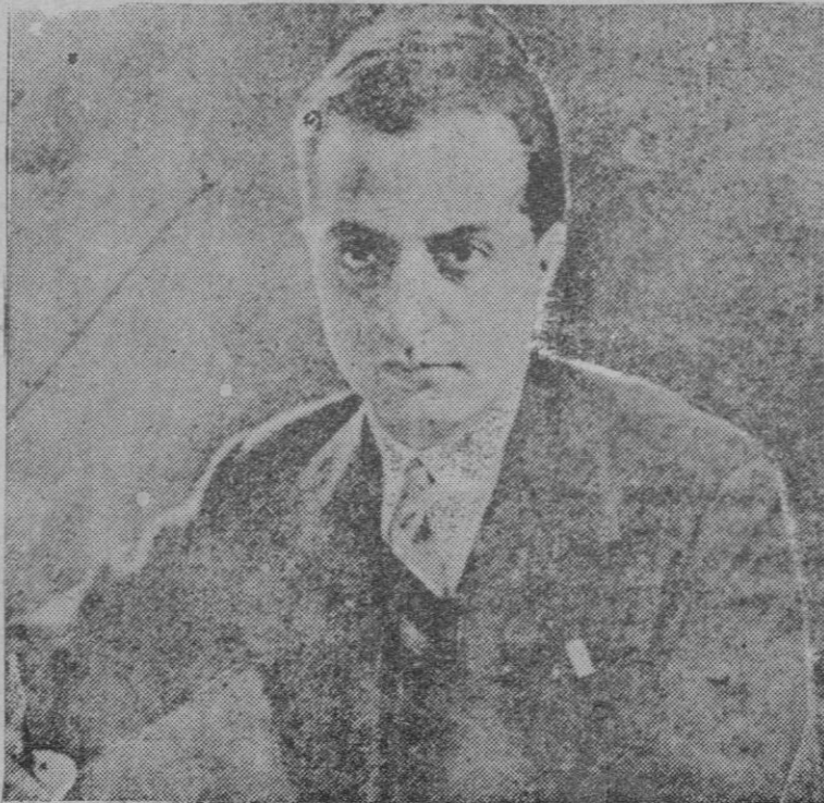
El Sr. Bottai, Ministro de las Corporaciones de Italia, que realiza un viaje por España