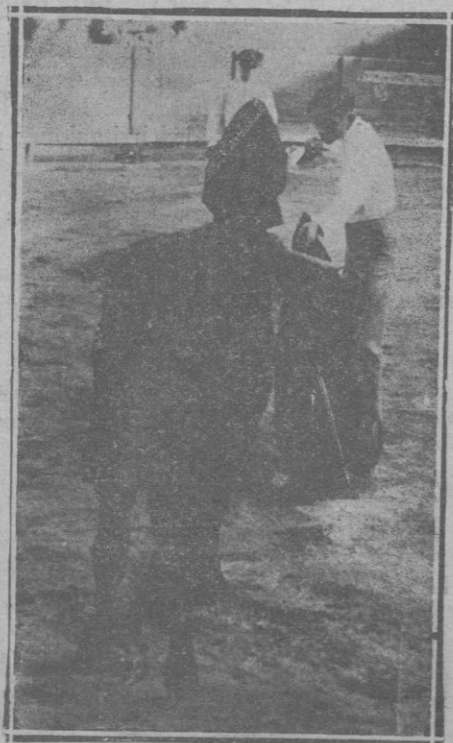
Perfilándose para una de sus certezas estocadas de efectos fulminantes