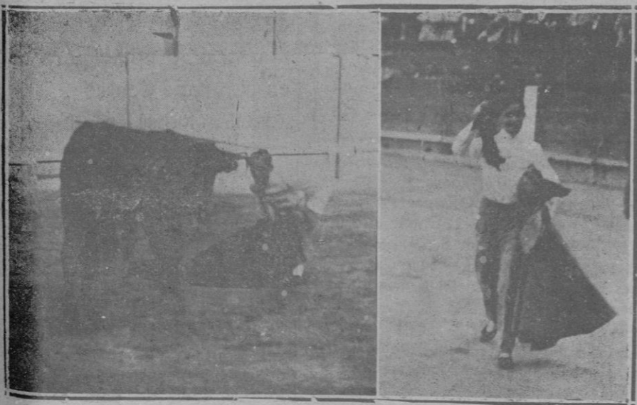
Después de una brillante faena de muleta, desafia de rodillas al bravo novillo