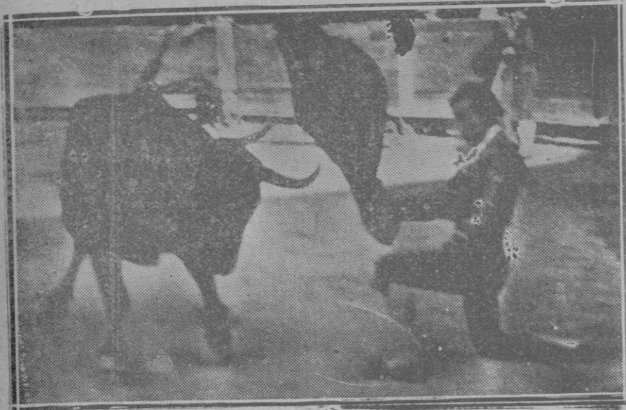
Niño de la Palma en un pase de rodillas