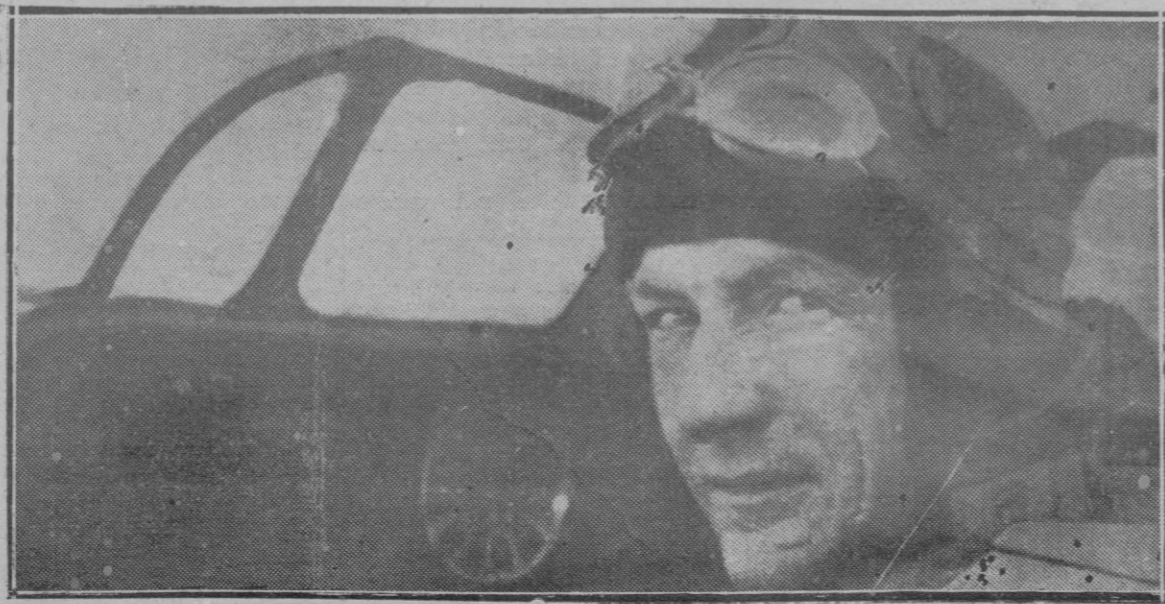
El aviador Nungesser, que emprendió el vuelo París-Nueva-York, cuyo paradero se ignora.