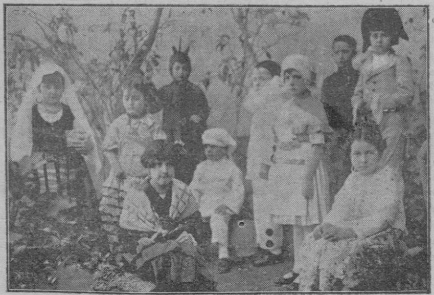
Grupos de alumnos que tomaron parte en la fiesta celebrada en los días de Carnaval, luciendo artísticos disfraces

y para culto de 1.200 pesetas anuales, cuyas dotaciones no podrán hacerse efectivas hasta tanto se incluyan en el Presupuesto por obligaciones eclesiásticas de este Ministerio.