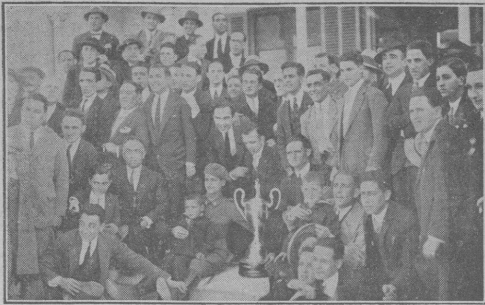
Asistentes al banquete celebrado en el Hotel Calamayor para conmemorar el XI aniversario de la fundación de la R. S. Alfonso XIII