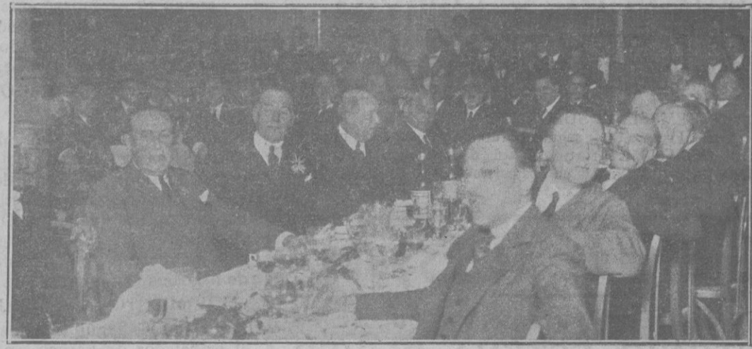
Aspecto parcial del comedor del Círculo durante la celebración del banquete para solemnizar el aniversario