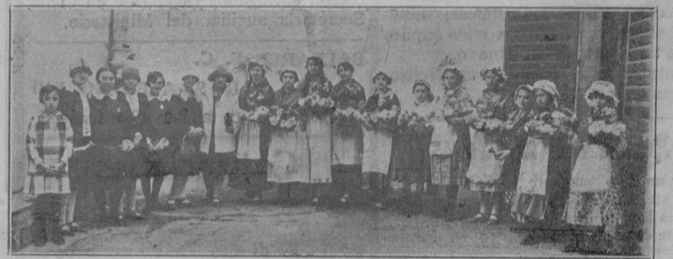
Grupo de alumnas que representaron la comedia en francés «Las floristas»