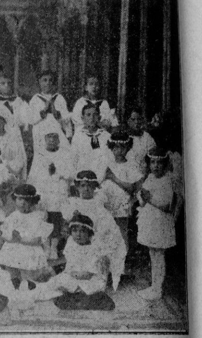
Grupo de niños que tomaron parte en la fiesta celebrada con motivo de administrarse la Primera Comunión

lando al señor de la barbita. —¿Yo un terrible bandido?—dijo éste muy asombrado—. ¡Pero si soy el recaudador de contribuciones!