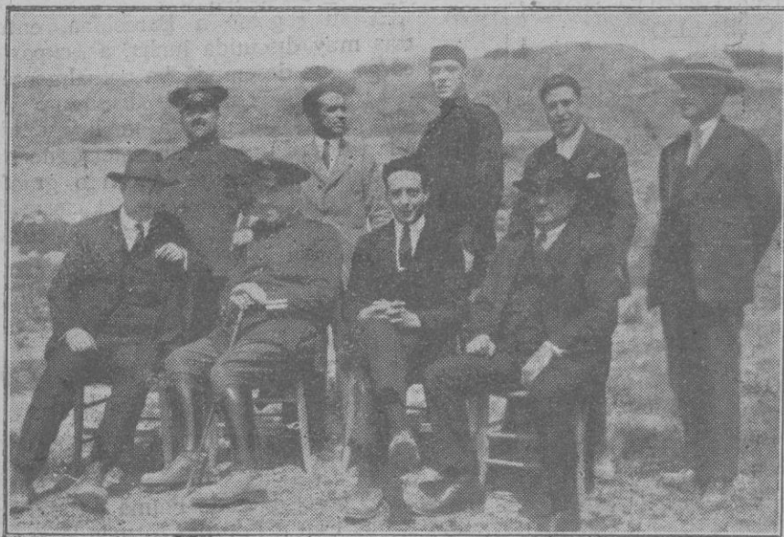
Grupo de tiradores premiados

Infante se propuso premiar el cuidado que había tenido ella de honrar las virtudes de su infancia. El Niño de Belén era por ella contemplado en brazos de su Santísima Madre, dócil y pronto a dejarse trasladar de Belén a Egipto y de Egipto a Nazaret... El divino obrero de Nazaret aparecía a sus ojos siempre atento a los trabajos que le confiaba su Padre putativo, siempre obediente a la menor indicación del representante de la autoridad del Padre celestial... Fué tan admirable en Teresa esta imitación de las virtudes de Jesús Niño, que, si ya no le hubiese tocado en suerte el nombre del Niño de Belén, sus hermanas hubieran tenido que apellidarlo con tan bendito nombre... Sabido es que un día el divino Maestro se apareció a su Santa Madre, y habiéndola preguntado cómo se llamaba, respondió la pia fundadora del Carmelo: «Teresa de Jesús», mereciendo que a su vez le dijese el Señor: «pues yo soy Jesús de Teresa». No de otra manera la carmelita de Lisieux podía decir que era su nombre «Teresa del Niño Jesús», puesto que Jesús Niño era el Maestro y el modelo de Teresa... A Jesús Infante pedía consejo en sus dudas, y de ese Niño, a quien en el taller de Nazaret se veía crecer en edad y en sabiduría,