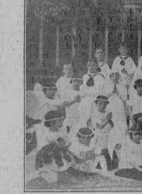
Grupo de niños que tomaron parte en la fiesta celebrada con motivo de administrarse la Primera Comunión

lando al señor de la barbita. —¿Yo un terrible bandido?—dijo éste muy asombrado—. ¡Pero si soy el recaudador de contribuciones!