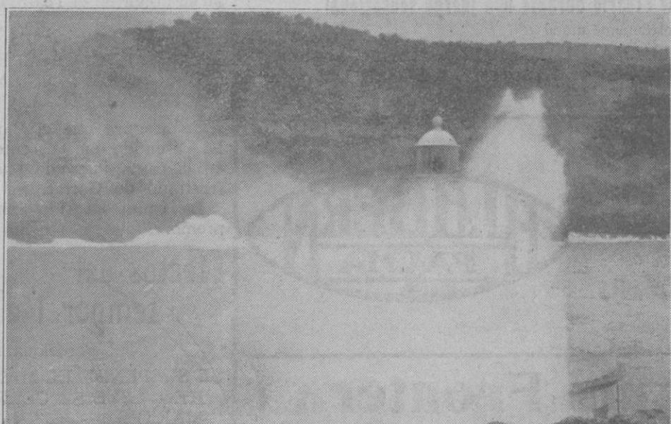
El oleaje irrumpiendo por el «bufador» y aislando el faro del puerto