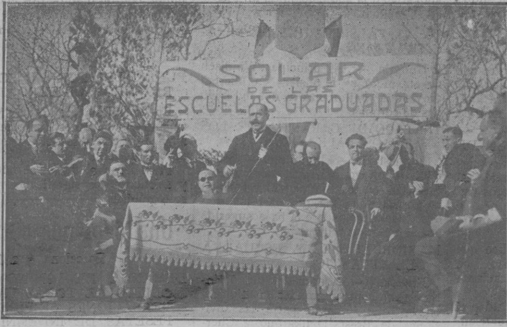
El Sr. Gobernador Civil, pronunciando un discurso