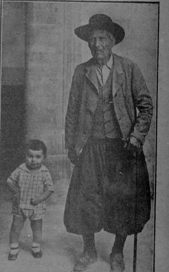
Un vecino de Pollensa, de los pocos que restan, que no han abandonado el traje típico de nuestros payeses, acompañado de uno de sus nietos