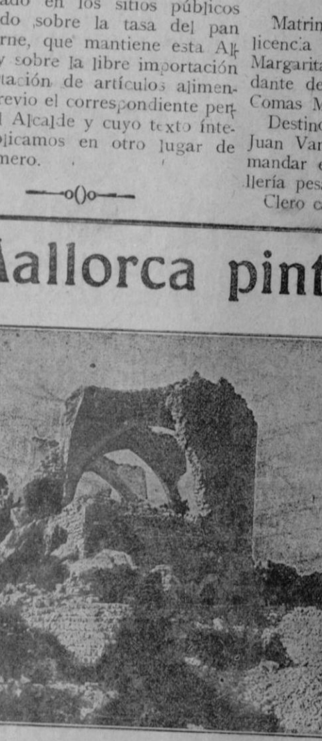
El Castillo dels Reys, de Pollensa.

Pérdida El 1.º del corriente se perdieron dos ruedas de r-cambio de automóvil con sus correspondientes neumáticos, en la carretera de Luchanayor. Se gratifica su devolución con 50 pesetas, en la calle de Polaires, n.º 104.