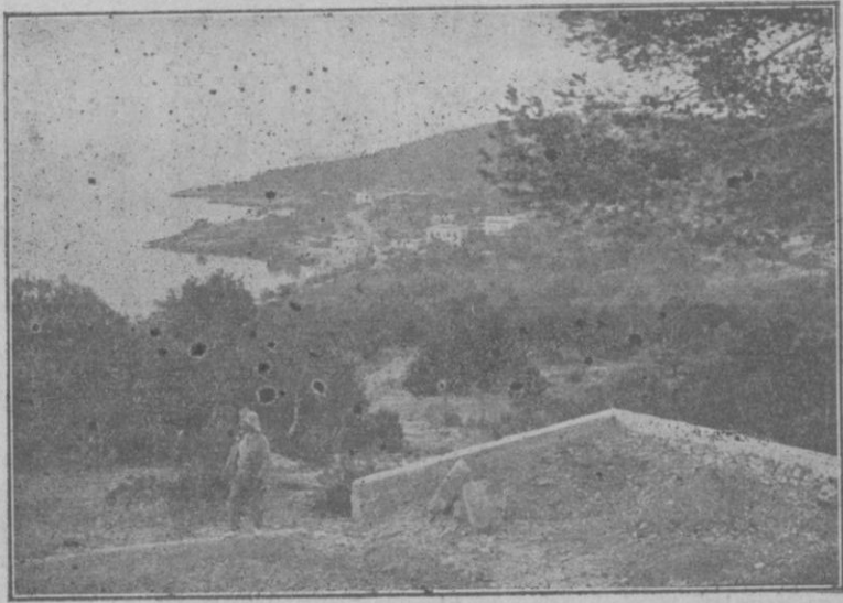
Una de las vistas que figurará en la película «Venganza» que acaba de impresionar la «Atlántida» en Mallorca. Está tomada desde una de las montañas que rodean a Calamasyor.