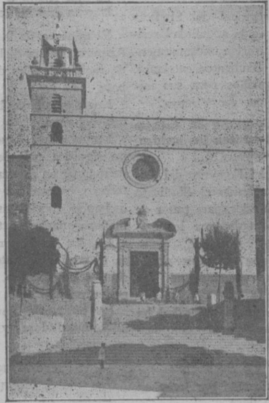
Iglesia-convento de San Antonio de Padua que acaba de ser restaurada, y cuya bendición solemne tuvo lugar el 22 del próximo pasado Julio.