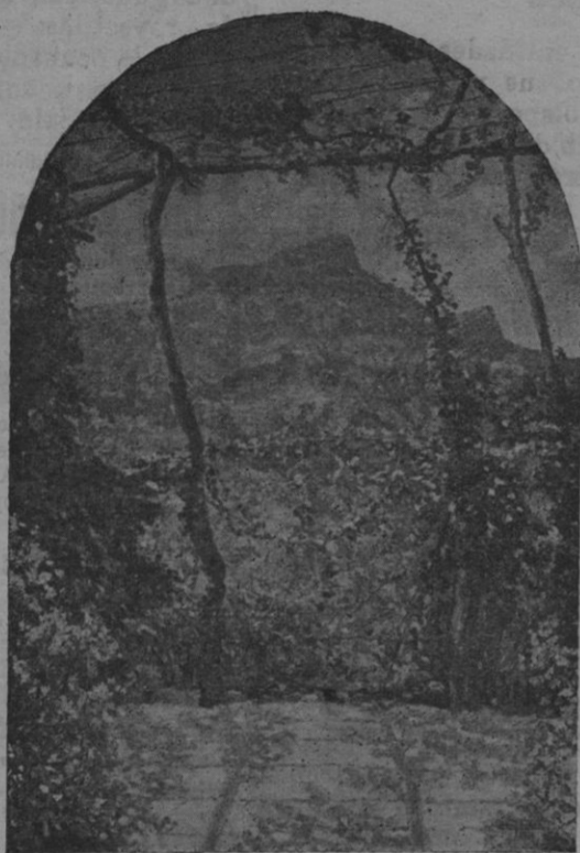
«Mediodía» otro de los cuadros de Pedro Barceló que figuró en la Exposición de Bellas Artes y que reproduce «La Revue Moderne de Paris».