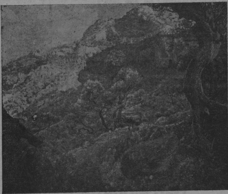
«Morro d'Estalenchs» cuadro que figuró en la Exposición Nacional de Bellas Artes, debido al pincel del notable pintor Pedro Barceló Oliver