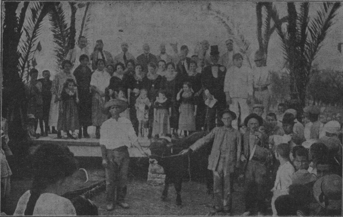
Elementos que en las fiestas tomaron parte. Se ve entre ellos al heraldo a quien nuestro estimado colaborador «Espinilla» le ha dedicado la siguiente composición.