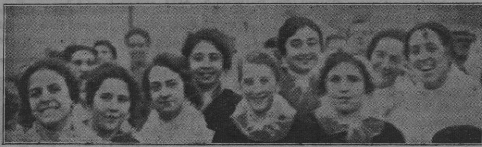
Grupo de señoritas veraneantes que luciendo el traje típico del país, dieron realce a la fiesta