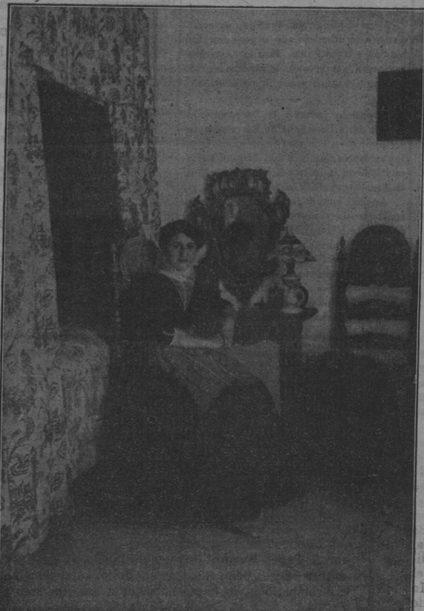
Una típica payesa en una alcoba antigua mallorquina.