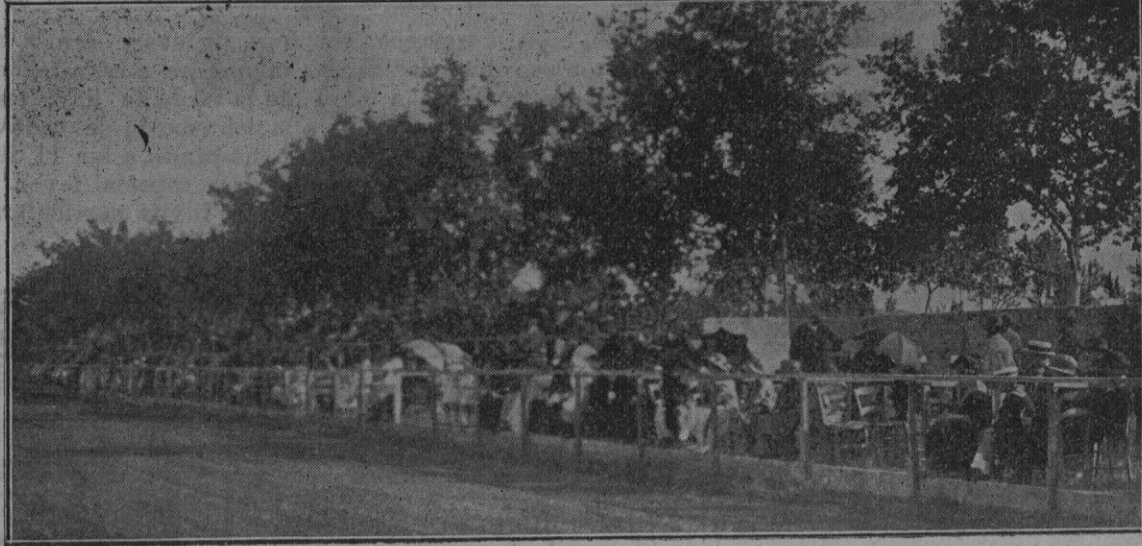
Un aspecto de la Tribuna