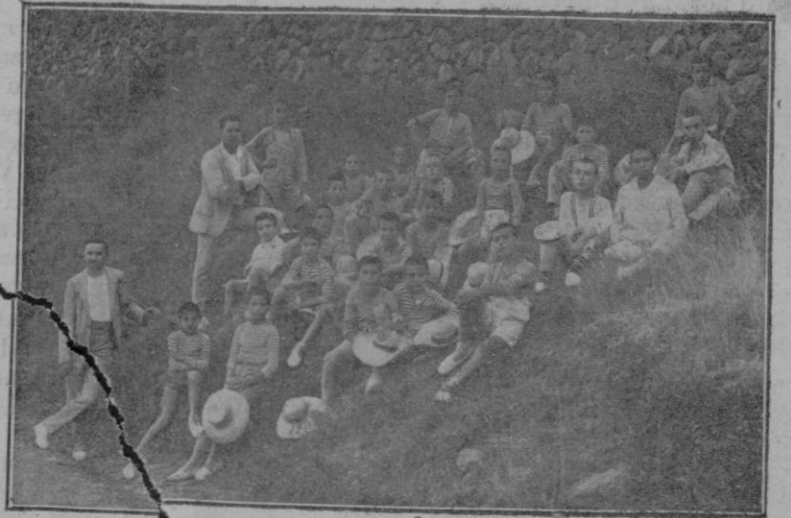
Los colonos en una excursión a Deyá