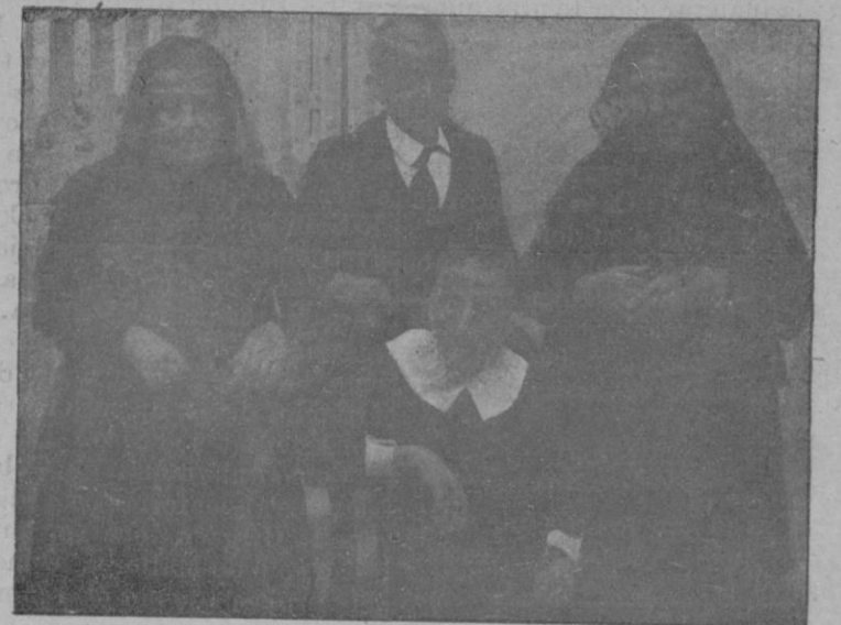
La centenaria, con su hijo, su hija y su hija política, los cuatro asilados en las Hermanitas de los Pobres.

de 7 a 3 millas con brisa; de 13 a 14 y media con buen viento y de 16 a 18 con fuerte viento.