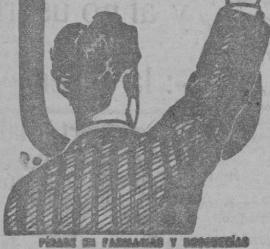
PIÑAS DE FARMACIAS Y BOTICAS

y los Médicos lo llaman el REMEDIO DE LOS DÉBILES