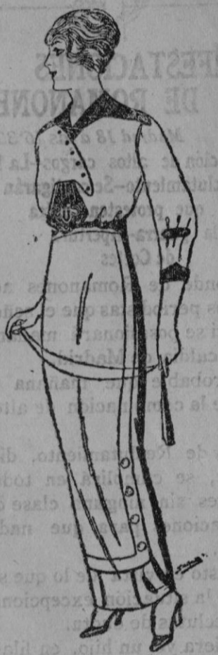
Blusa de seda blanca y colores adornos bordados á 25 Ptas. Faldas de lana de Ptas. 11 á 22.

Confecciones de todas clases para Señora y Niña Ropas confeccionadas para Caballero y Niño y Artículos de la Temporada