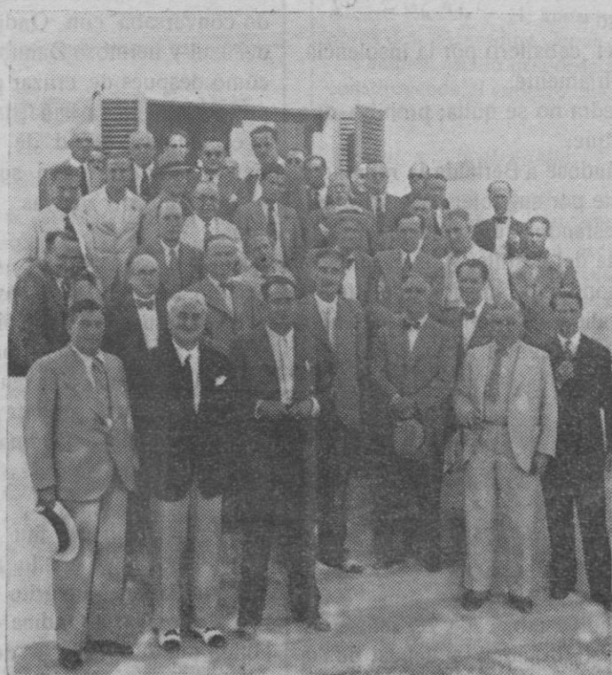
Grupo de invitados a la inauguración del Hotel Cala d'Or