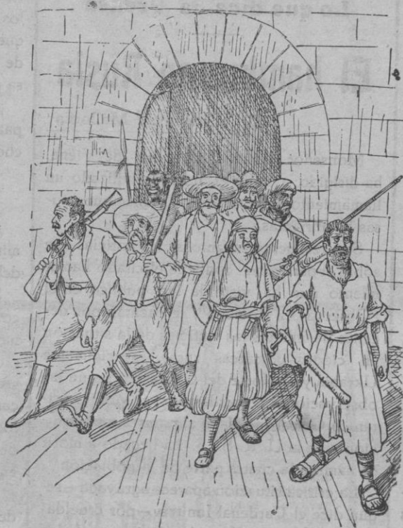
S'obrin ses portes i surten tretze homos tan gradolassos...

S'obrin ses portes, i surten tretze homos tan grandolassos que pareixien gegants, i se'n van de d'allà.