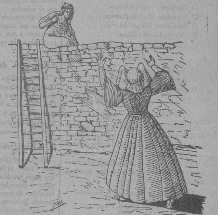
Me'n vaig ara mateix a ca'n Bernadet! diu Na Catalineta.

—¡Senyora Alteza! ¡Senyora Alteza! crida sa dida. ¿Y ara que fa? ¿Peró que fa? ¿pero que ha fet?