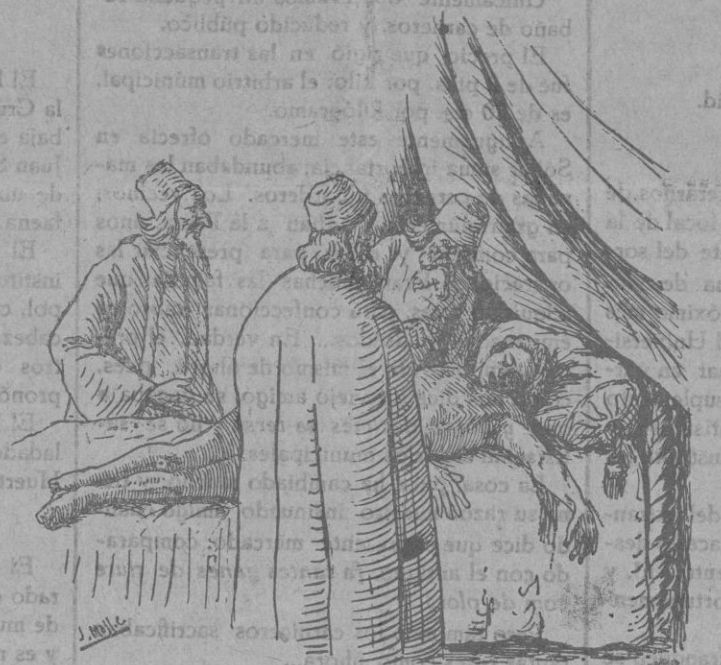
Metges y cirugians li regonegueren ses ferides

En Bernadet el colgaren, comparagueren es metges y cirugians. Li rentaren y regonegueren ses ferides y ubertes, li posaren mil suchs y auguents y l'embenaren tot. Y el Rey y es Metges, nobles y criats no el deixaren de dia ni de nit, retgirat totíom de que el pobre ferit no fes pell, com prou hauria penat.