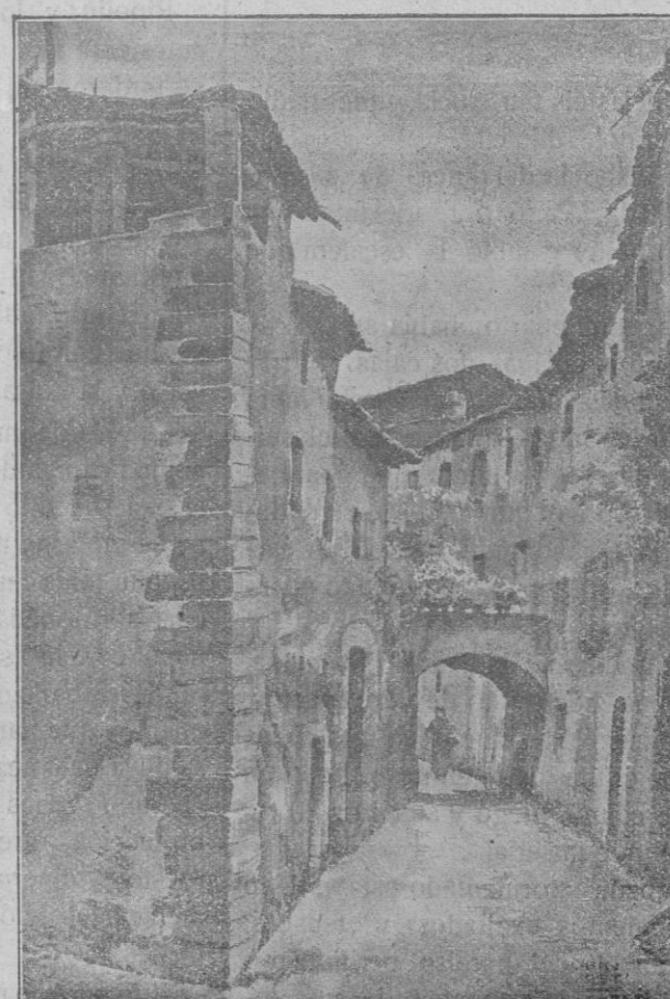
Una antigua calle del pueblo de Corsá (Gerona)