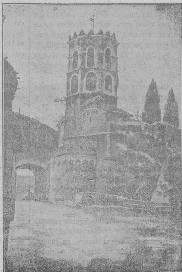
El "Cloquer" y parte de las murallas del cenobio de Galligans (Gerona)