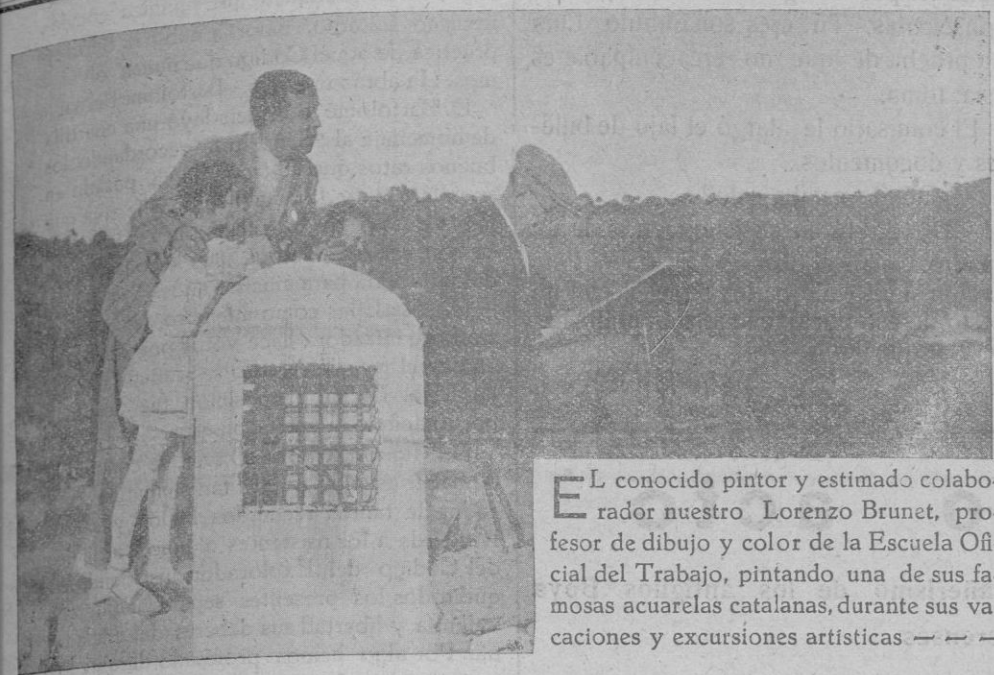
EL conocido pintor y estimado colaborador nuestro Lorenzo Brunet, profesor de dibujo y color de la Escuela Oficial del Trabajo, pintando una de sus famosas acuarelas catalanas, durante sus vacaciones y excursiones artísticas.