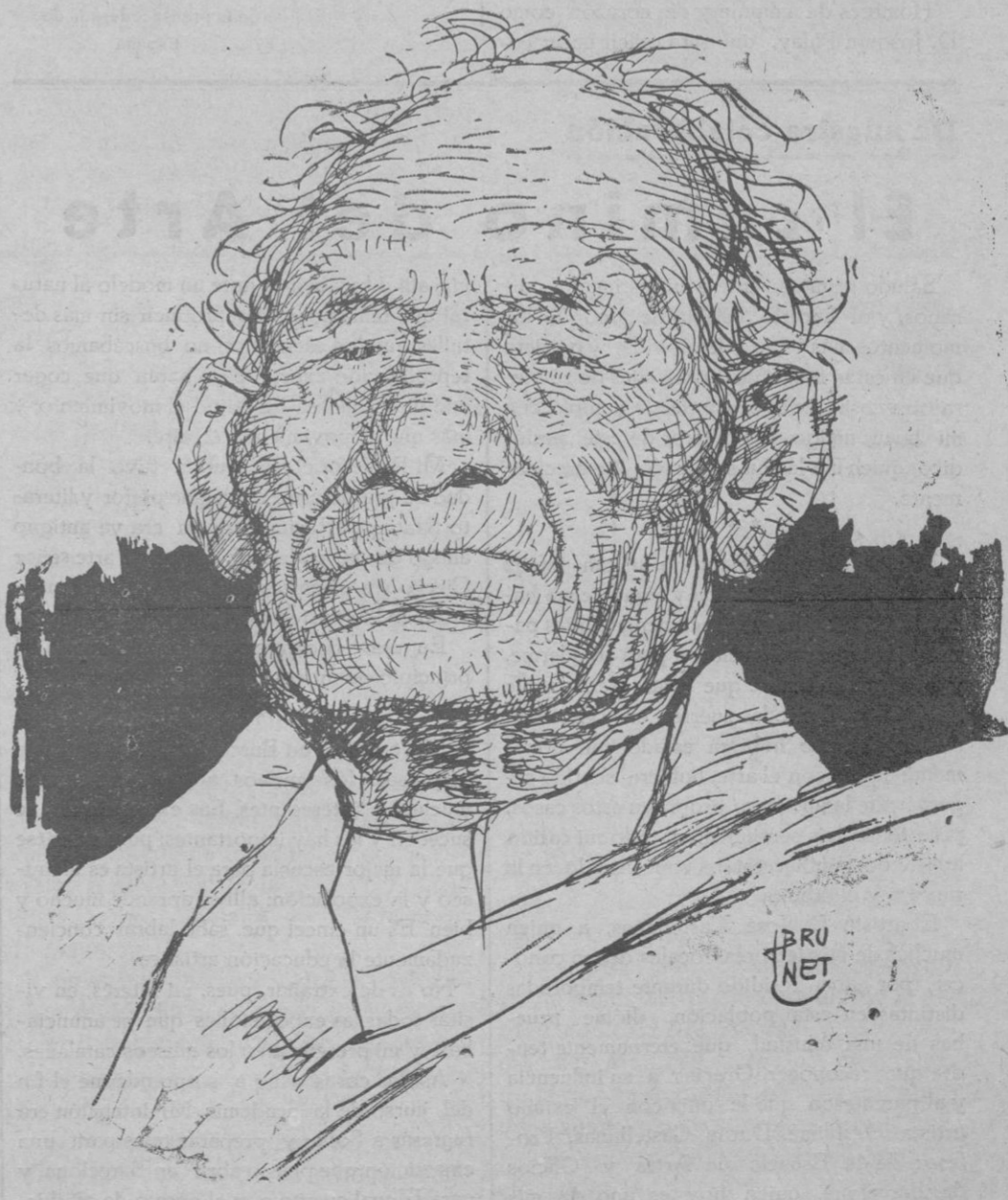
L'AVI XANO. — Llano del Llobregat (Barcelona)