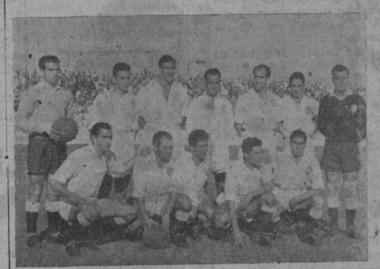
Un aspecto de la tribuna de Son Canals ayer tarde y el equipo del A. Jaen que venció al A. Balears.

POR EL HELL SE NOS HA DICHO... IMPRESIONES DE NOTICIAS RADIOTELEGRAFICAS INSERTAS EN LA PRENSA MATINAL