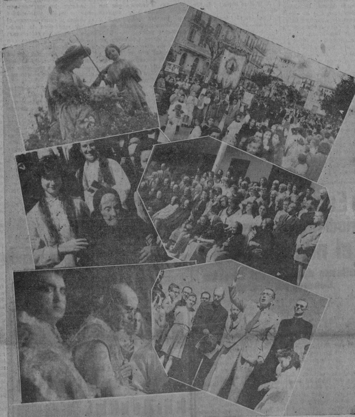
En este reportaje de Julia ofrecemos a los lectores de izquierda a derecha: la procesión celebrada ayer tarde por los PP. Capuchinos y la imagen de la Divina Pastora que la presidió; la más anciana que presidió la fiesta de la Vejez celebrada ayer y la concurrencia que asistió a ella; y dos momentos del homenaje rendido al Padre Economo de Génova. (Reportajes Palma)