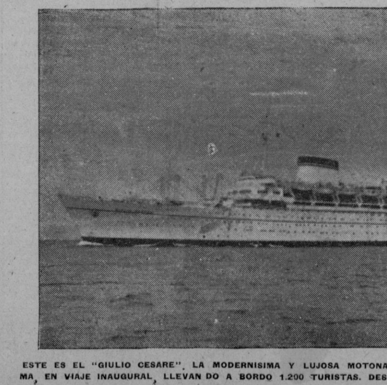
ESTE ES EL "GIULIO CESARE", LA MODERNISIMA Y LUJOSA MOTONAVE QUE MAÑANA ARRIBARA A PALMA, EN VIAJE INAUGURAL, LLEVANDO A BORDO 1.200 TURISTAS, DES PLAZA 25.000 TONELADAS