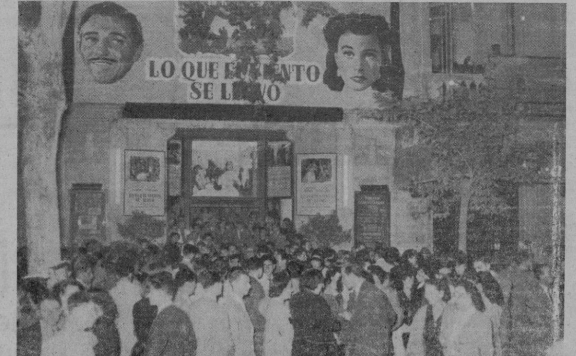
Aspecto que ofrece diariamente la entrada principal de la Sala Born con motivo de la aglomeración de numeroso gentío que asiste a la proyección de LO QUE EL VIENTO SE LLEVO