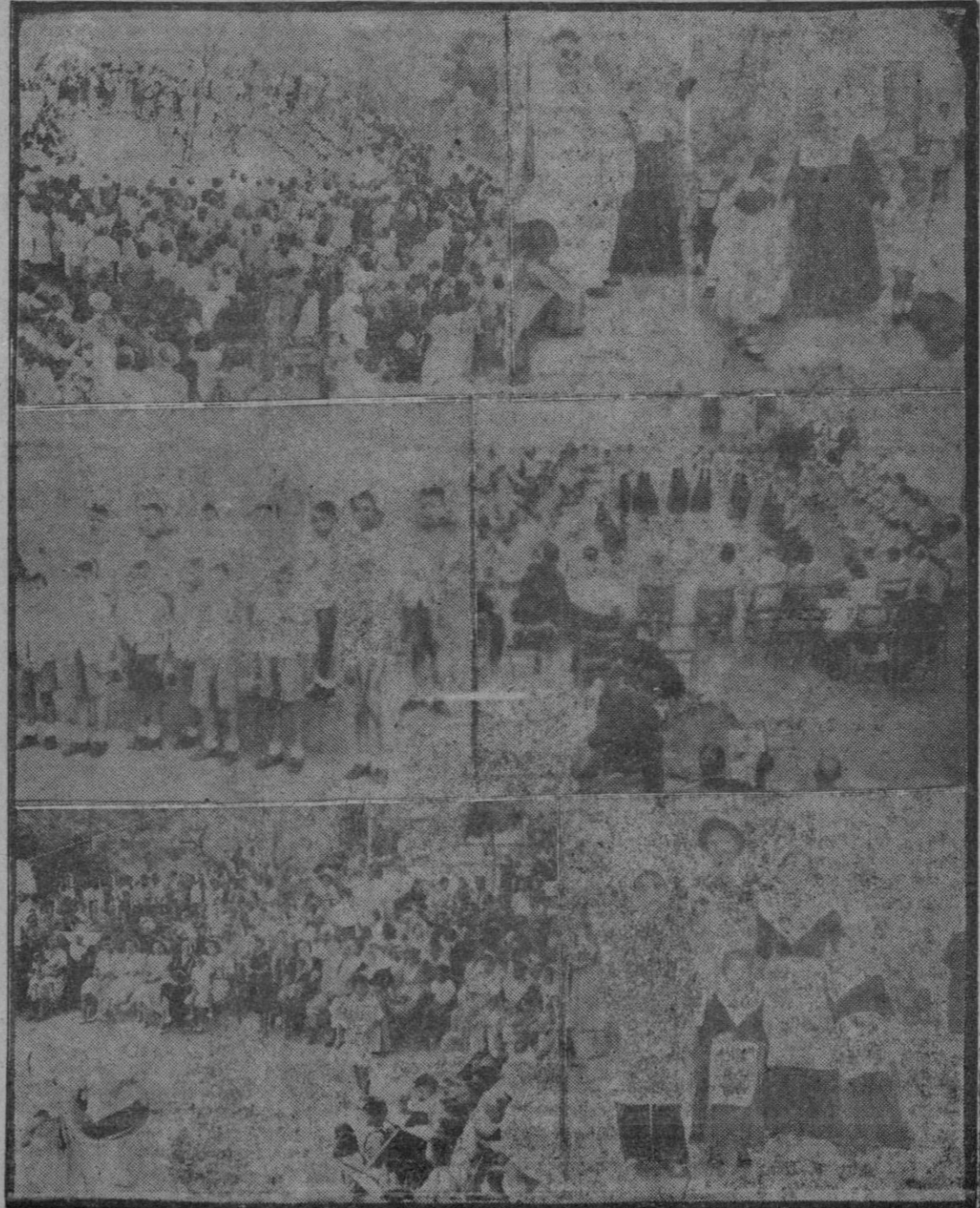
UN FOTOMONTAJE DE REPORTAJES PALMA, PARA NUESTRO PERIODICO DE LA INTERESANTE FIESTA CELEBRADA AYER EN EL "PUIG D'ES BOUS"

Hoy la página 2 está dedicada a noticias de la tarde