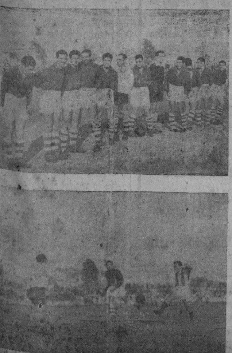
El equipo del "Cacereno" y una jugada del partido celebrado ayer en el cual venció brillantemente el Atlético Baleares.