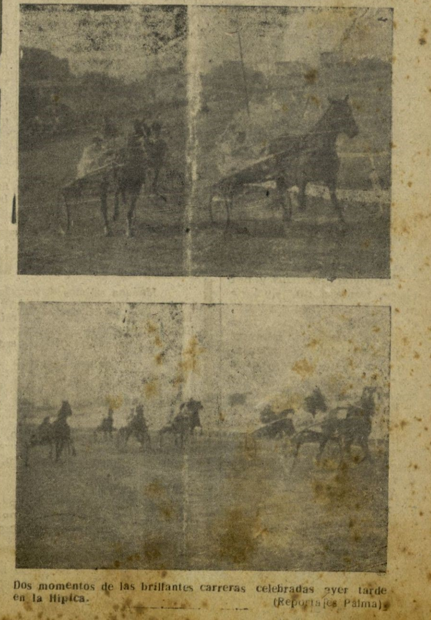
Dos momentos de las brillantes carreras celebradas ayer tarde en la Hípica.