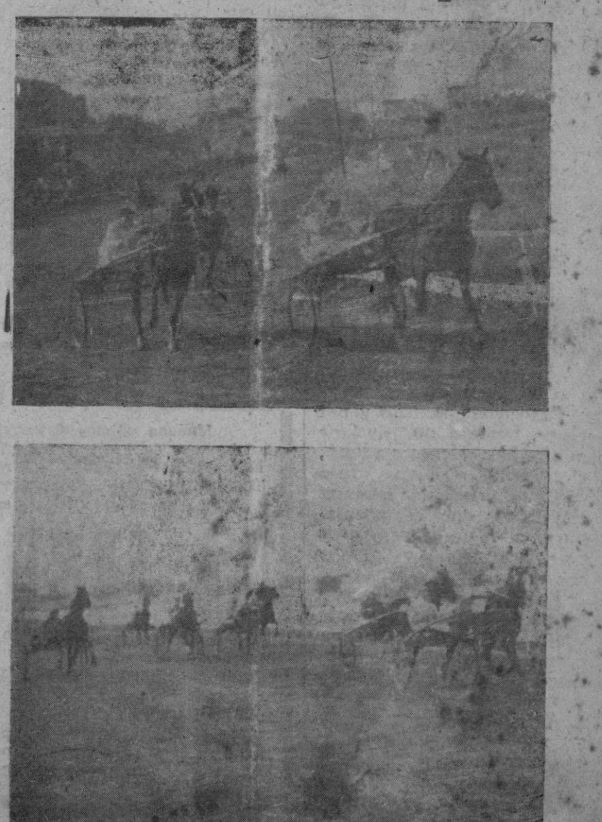
Dos momentos de las brillantes carreras celebradas ayer tarde en la Hípica.