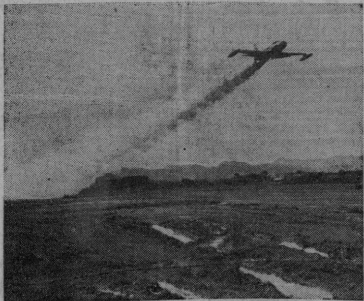
AVIONES DE REACCION

Un F-80 "Shooting Star", avión a propulsión, perteneciente a la Quinta Fuerza Aérea Norteamericana, se eleva desde el aeródromo en Corea para bombardear los objetivos nortecoreanos y chinos, comunistas.