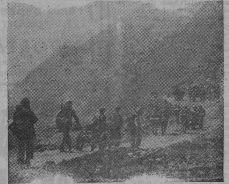
GUERRA EN COREA

Tras una buena "limpieza" por medio de fuego artillero y de morteros, los célebres "Marines" americanos — que conforman las fuerzas de las Naciones Unidas — se dirigen a ocupar posiciones estratégicas en el Norte de Corea.