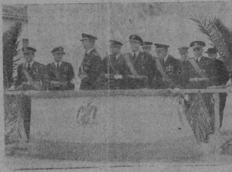
El General White de la Zona Aérea rodeado de su Estado Mayor y un momento de la Jura de la Bandera en el campo de San Juan