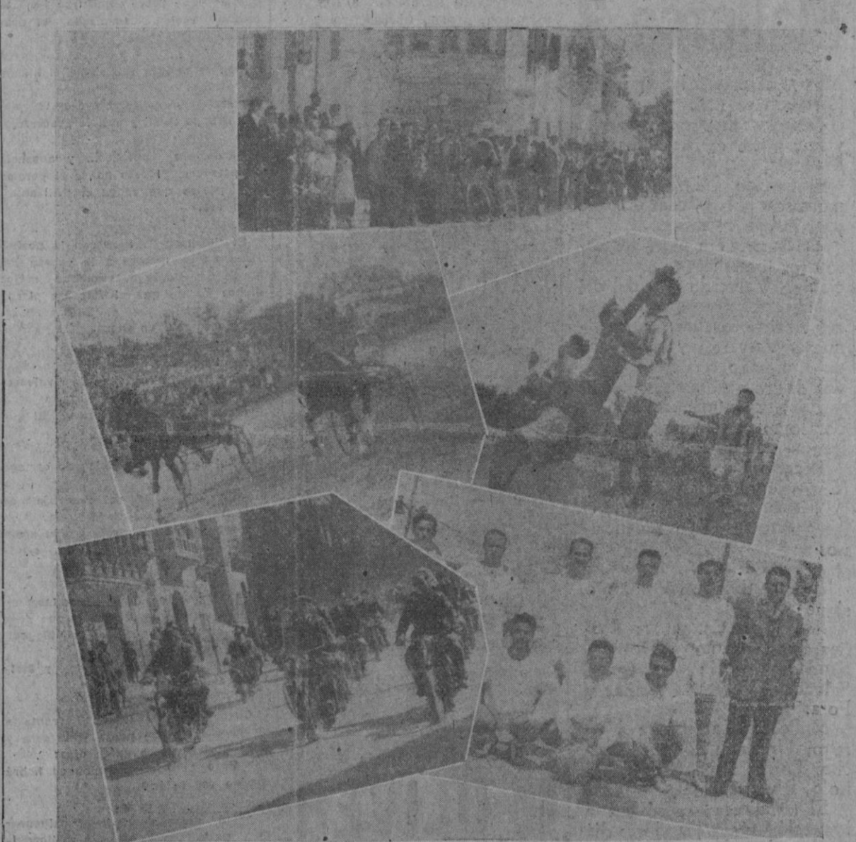
Publicamos una mesa vuelta obtenida por "Reportajes Palma" de los principales actos deportivos celebrados ayer. En la parte superior el momento de la salida para el circuito ciclista; en segunda línea una carrera en la Hipica y una jugada en Son Canals y en la parte inferior la excursión aniversario del Moto-Club y el equipo de baloncesto "C. D. Hispania"