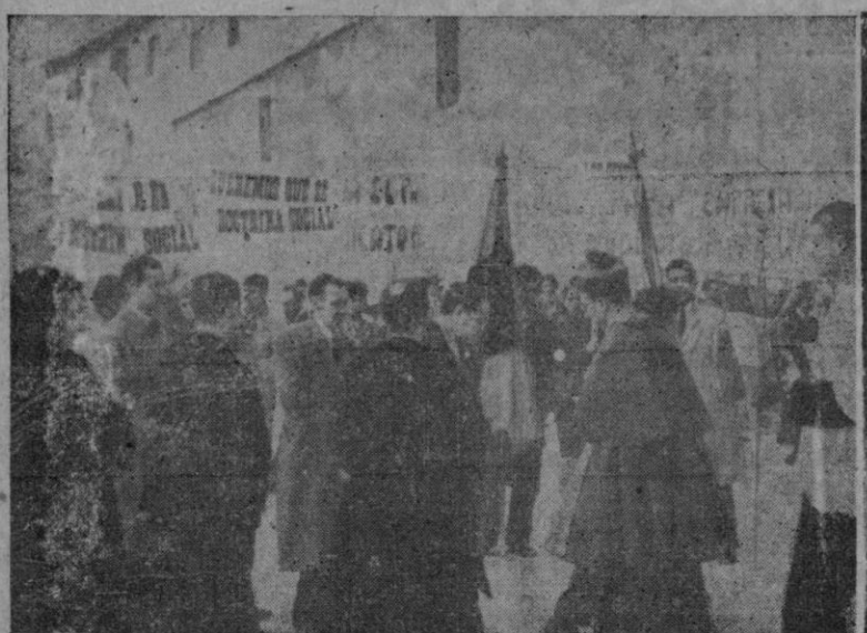
El Excmo. y Rvdmo. Sr. Obispo es saludado por un grupo de asistentes al grandioso acto religioso-social de ayer, junto a las vibrantes pañcartas llevadas por miembros de la Organización Sindical