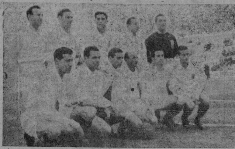
El equipo del Ceuta que perdió ayer en "Es Forti"

Acudiendo con amor propio y evidenciando buena preparación física