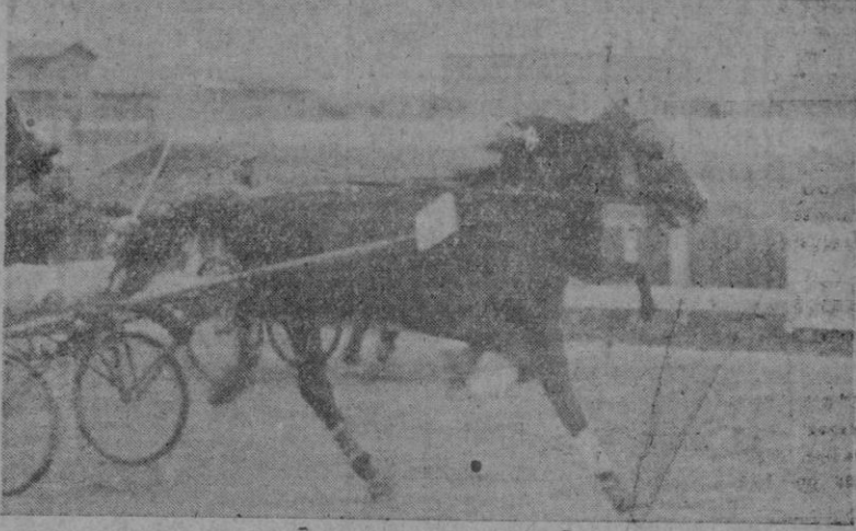
Emocionante final de la segunda carrera de ayer en la Hipica