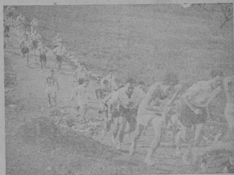
Una fase de la gran 'Diada Deportiva' organizada por el Frente de Juventudes.