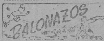
Mucho frío en "El Forti". un frío "interior" un intenso, que luego a superar el del medio ambiente.

Ayer había un soporífero en el terreno de juego. Lastim, de un Brechó, va a para orquestrar la música de viento que allí sonó.