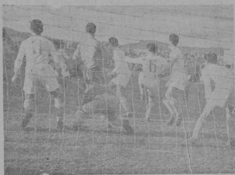
Una de las empujadas jugadas del partido Mestalla Mallorca del partido celebrado ayer en "El Forti" (P. Toñalá)

Partido más y pesimamente jugado por los mallorquinos