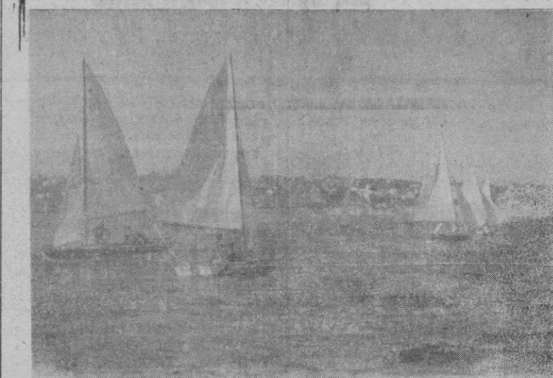
Un momento de las regatas celebradas en "Cala Nova" (San Agustín)