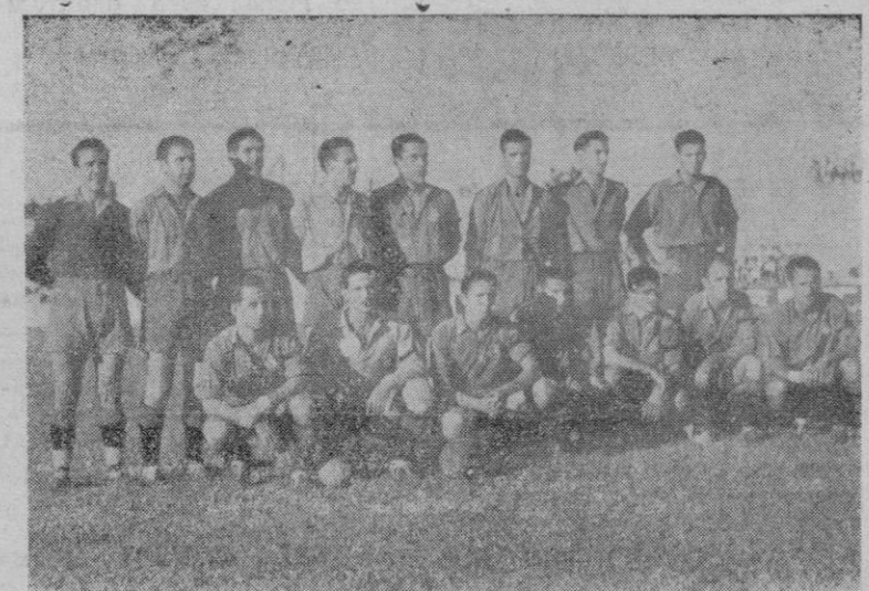
El equipo del "Mallorca" que ayer, por la tarde, se enfrentó al "Valencia" en "Es Forit"

(1) Así llamábamos en mi juventud al piramidón, para mayor facilidad lingüística.