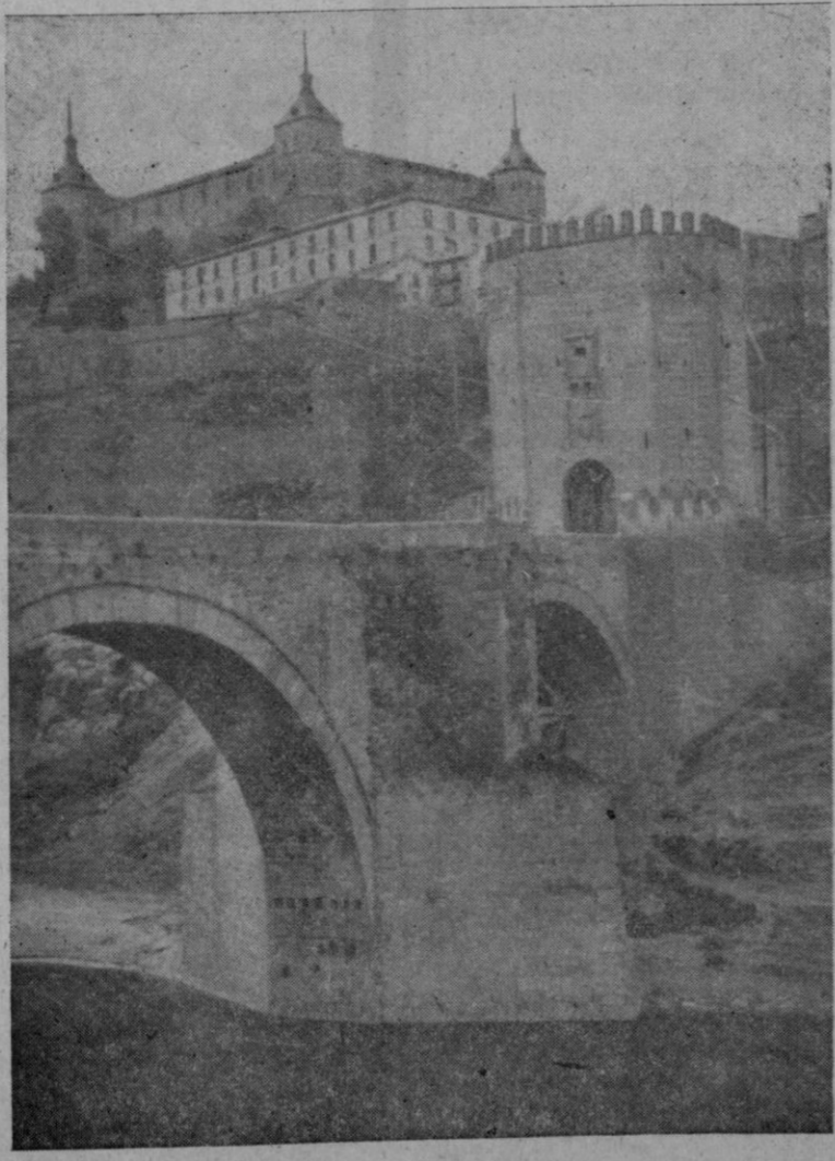
(Pasa a 2.ª pág.)

Productos: Vinos espuma. Cambios: Dólares, 19'71; libras, 79'43; francos suizos libras, 467'82; francos belgas, 44'997; florines, 742'948; escudos, 79'43 coronas suecas, 5'489; coronas danesas, 413.