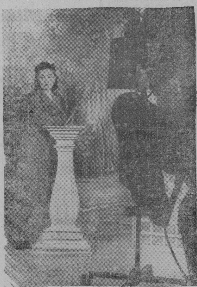
La Sra. Winifred Shetter, actriz de teatro inglesa, ha sido elegida para actuar de "Speaker" de televisión de la BBC, de un total de 119 candidatas. Es fotográfica recoge el momento de las pruebas efectuadas en el estudio de televisión de Alexandra Palace, en Londres