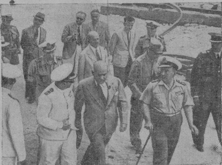
El Director General de la UNRA visita Grecia acompañado del Primer Ministro Almirante Voulgaris