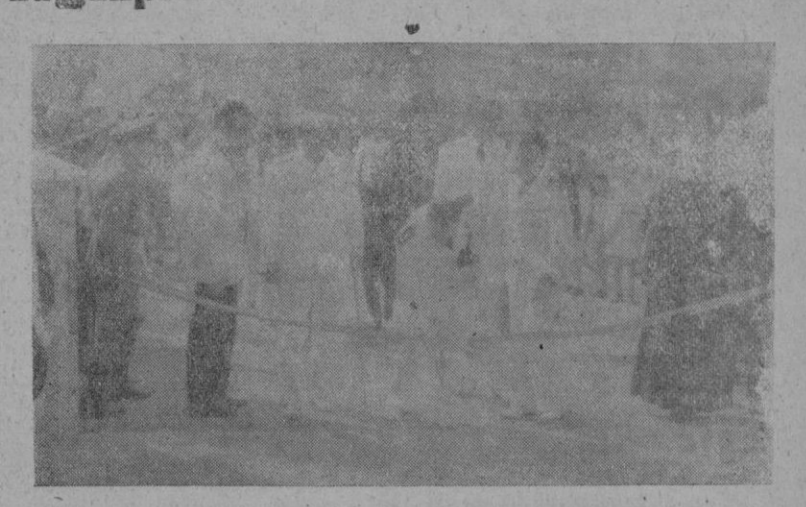
EL EXCMO. SR. GOBERNADOR CIVIL Y JEFE PROVINCIAL CORTA LA CINTA, ABRIENDO LA EXPOSICION