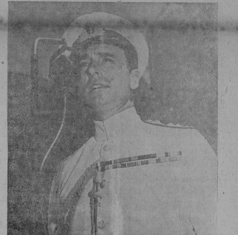
El Almirante Inglés Lord Louis Mountbatten, Jefe Supremo del Sudeste de Asia, ante el microfono de un portaviones americano felicitando a sus oficiales y marinería por el ataque a la base japonesa de Sabang, en el norte de Sumatra.