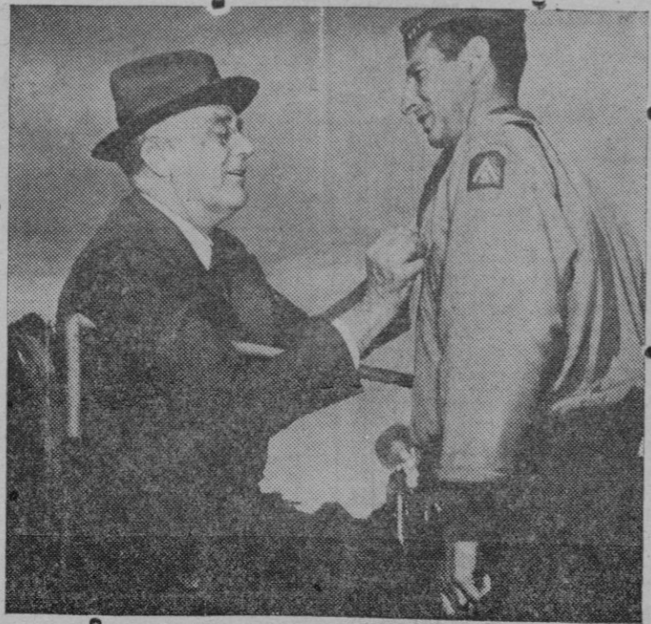
CLARK CONDECORADO.— El Presidente Roosevelt impone la Cruz de Servicios Distinguidos al Teniente General Clark, durante su estancia en Sicilia de regreso de las Conferencias en el Oriente Medio.

—“Hasta qué punto el reglamento de las Cortes ampara la libertad estricta del voto?” —“Como la estructura de este organismo de poder no estriba en el juego de mayorías, es perfectamente lógico que el procurador tenga — es más se le exige, en conciencia — plena libertad a la hora de la votación.”