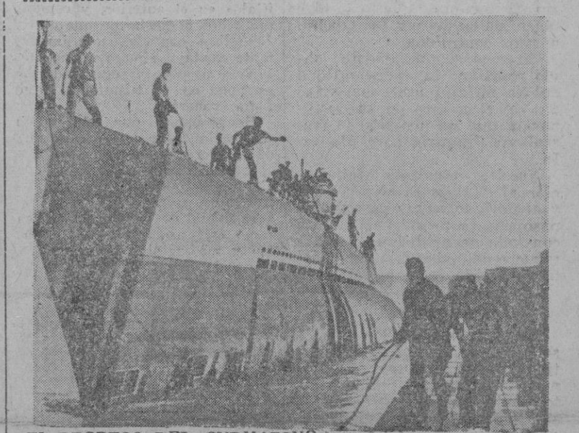
EL REGRESO DEL SUBMARINO NEMO.—Un submarino alemán de abastecimiento regresa después de cumplida su misión en el Atlántico.

Esta cifra equivale a las escuadras de combate con efectos de guerra y a unos tres mil pilotos, por lo menos, con una instrucción prolongada.—Efe.