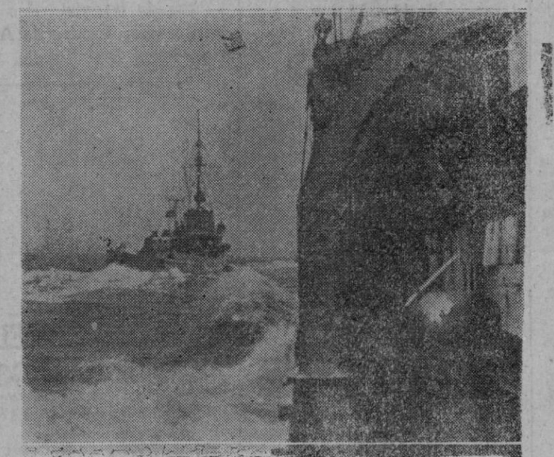
LAS MINAS SUBMARINAS Y EL BUEN TIEMPO. — Con la Primavera se nota una vuelta a la actividad en el mar. En estos días flotillas de minadores alemanes surcan las aguas del Mar del Norte para renovar las barreras de defensa ya establecidas.

París. — La intensificación del bloqueo aliado contra Alemania es interpretado por los periódicos como un verdadero sitio económico.