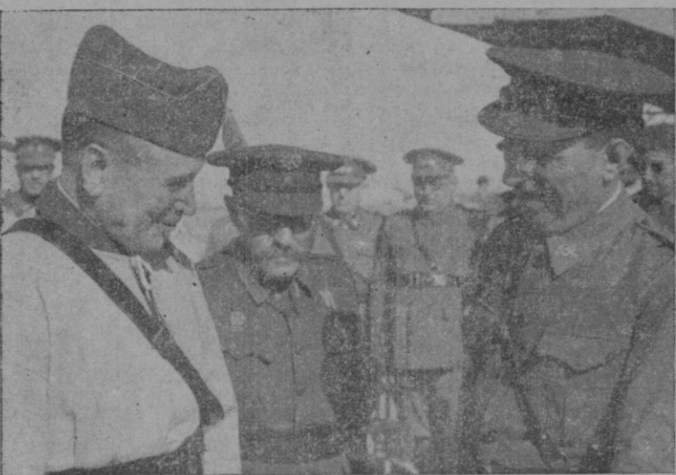
El General Ponte hablando con el Alcalde de Palma Teniente Coronel Sr. Riera. En el centro el General Cánovas Lacruz.

LA ULTIMA HORA, desea al señor Ponte Manso de Zúñiga que su estancia entre nosotros le sea grata.