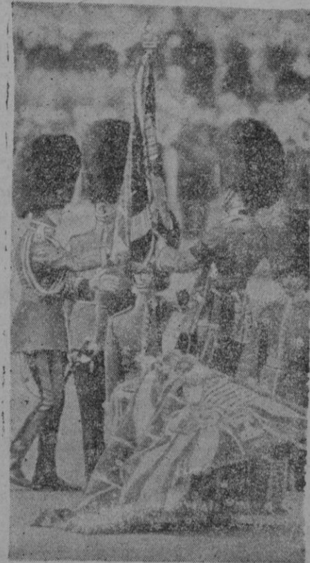
Ceremonias militares inglesas, con su teatro y sus costumbres de ornamentar banderas. La vista de estos actos no inspira inquietudes, pero...

Tuvo el gobierno polaco un dilema. Pudo decidirse por Londres o por Berlín. Pero se equivocó. Yerra Polonia si cree servir a sus intereses con las equivocadas reclamaciones de territorios que ahora propaga, y que harían del mar Báltico, si lo