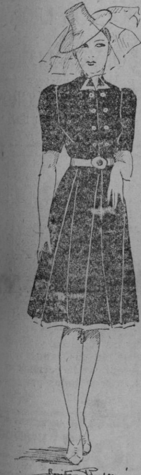
Simple y elegante vestido en piqué de seda azul marino. Adornos blancos