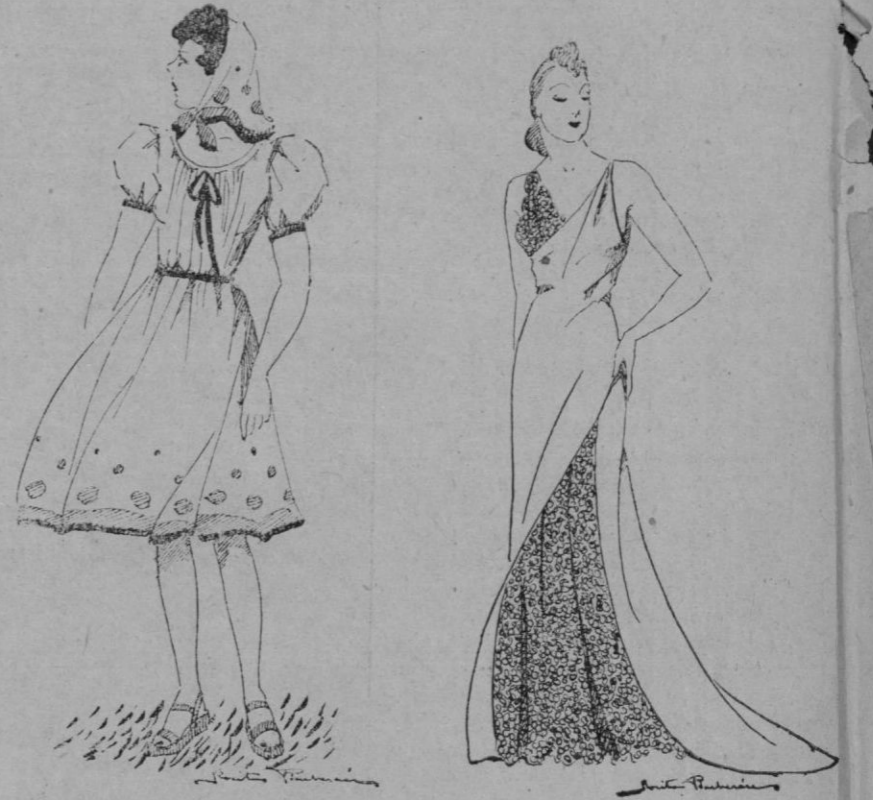
Bonito vestido para el campo en tela de hilo blanco. Aplicación s en hilo verde oscuro y v.r. de claro

Antes de aplicar el hené es menester que el pelo haya sido lavado y secado, preferiblemente el día anterior a la aplicación del hené . Se deja la pasta según el tono que se quiera obtener, siendo el promedio cinco minutos. Acárase luego bien el pelo y se deja secar. La aplicación deberá hacerse por mechones de pelo, comenzando por la raíz.