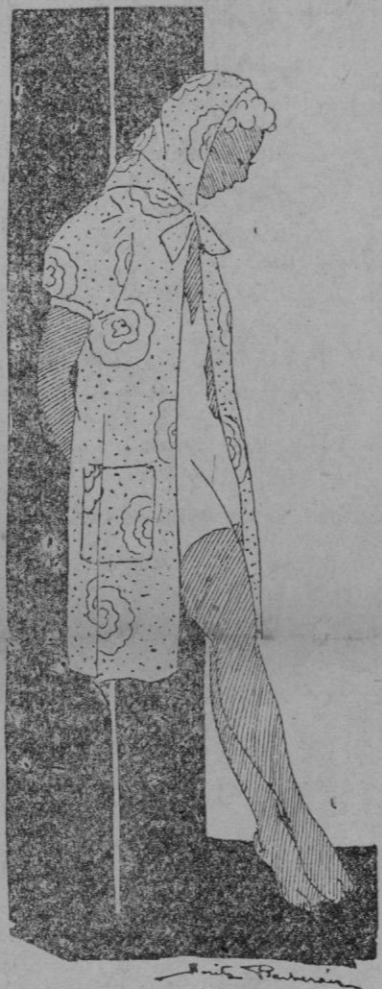
Moderna salida de baño en fondo blanco con dibujos negros o rojos. Muy bonito para llevar con maillot blanco

Puede quitarse una mancha de grasa caída en un traje de satén vertiéndole encima una gota de amoníaco; cuando éste se haya evaporado, póngase sobre el revés un trozo de papel lsecante y pásesele una plancha caliente por encima. La mancha será absorbida inmediatamente.