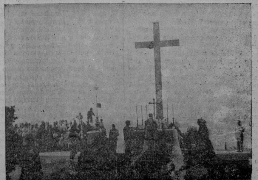
Recordemos la inauguración de la Cruz de los Caídos