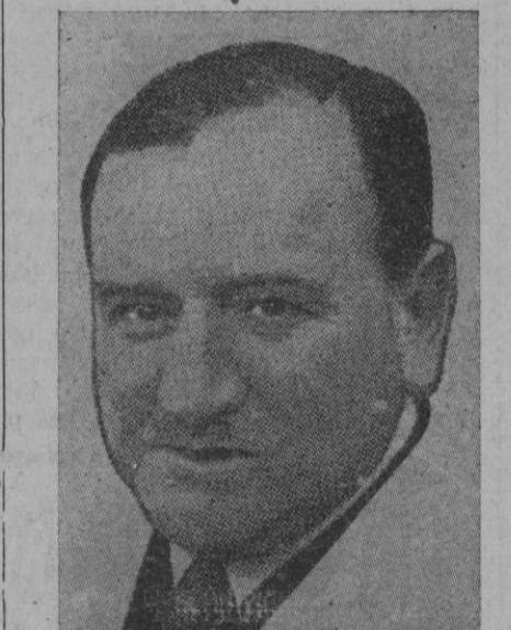
EL PRESIDENTE DEL GOBIERNO FRANCÉS, MR. DALADIER