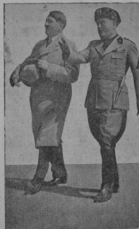
EL DUCE MUSSOLINI Y EL FUHRER HITLER

OBRAS DE LITERATURA GENERAL LIBRERIA JOSE TOUS