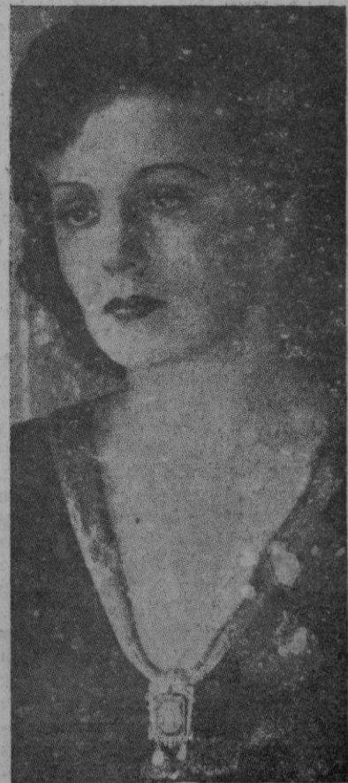
La novel y ya famosa estrella cinematográfica Zarah Leander, protagonista de la película «La Góndola cautiva» que se estrena hoy en el cine Bora.

París. — El reconocimiento del espionaje en Francia que se ejercía con toda libertad desde hace un año es preocupación preponderante del Gobierno desde su llegada al poder; a este respecto "L'Intransigeant" da cuenta que por un decreto francés se agravan sensiblemente las penas previstas hasta ahora pudiendo llegar hasta la muerte en los casos más graves.