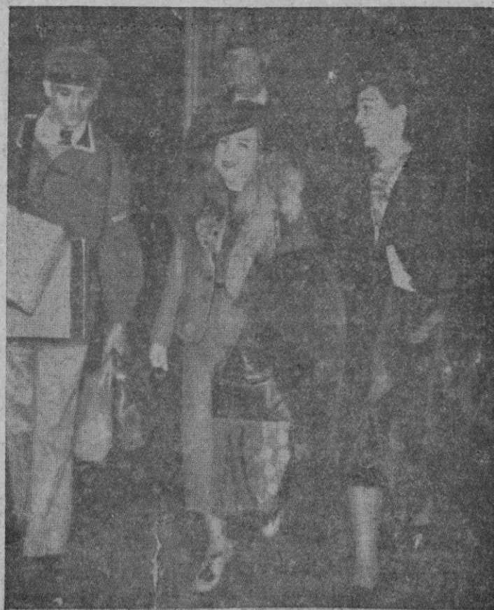
La esposa y la hija del «Presidente» de la «Generalidad» Companys a su llegada a París donde llegaron ha poco huyendo de las «delicias» de Cataluña